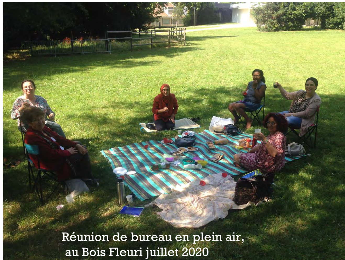
Réunion de bureau en plein air, au Bois Fleuri juillet 2020